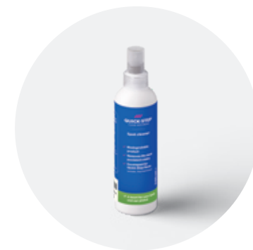
Foltisztító 250 ml QSSPOTCLEAN