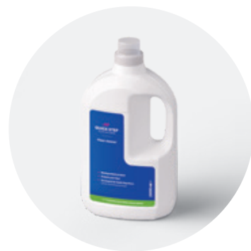
Padlótisztító 1 l vagy 2 l QSCLEANECO1000 QSCLEANECO2000